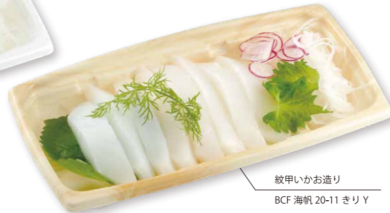
紋甲いかお造り BCF 海帆 20-11 きりY