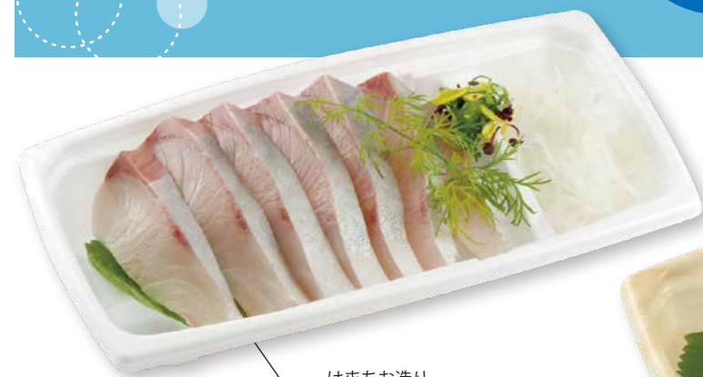
はまちお造り BCF 海帆 20-11