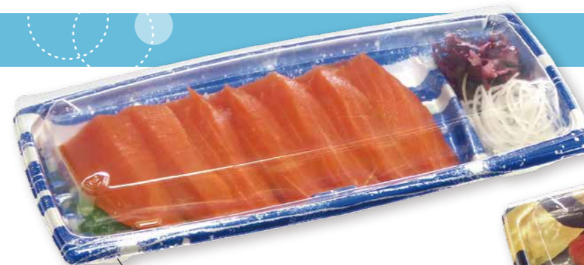
たっぷりサーモンお造り BCF 海帆 25-11 麗 B