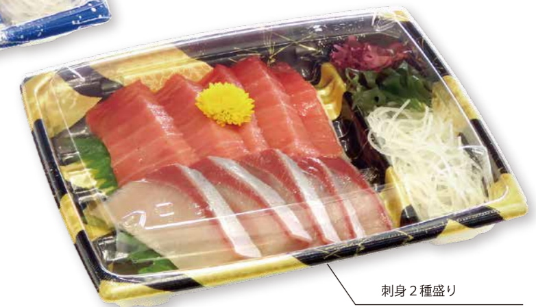
刺身2種盛り BCF 海帆 20-17 光舞 BK