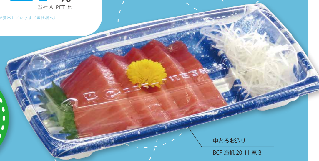
中とろお造り BCF 海帆 20-11 麗 B

バイオ CF は 植物由来プラスチックを 10% 使用した 環境配慮型製品です。